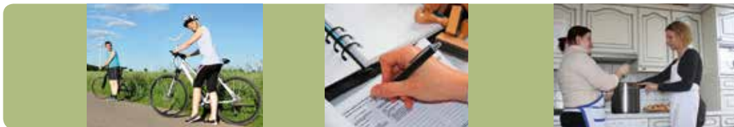
Die ambulante Teilhabeleistung unterstützt bei der Eingliederung in den Alltag.